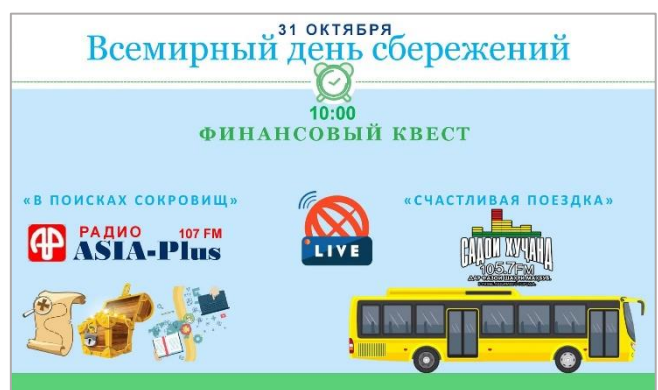
Online-Weltspartag in Tadschikistan

Die National- und Zentralbanken bieten die duale Ausbildung auch künftig in den verschiedenen Regionen an. Die finanzielle Bildung ist fest in den Lehrplan der Schulen integriert, die Strukturen für die außerunterrichtlichen Zirkel sind etabliert. Und den Nutzen von Sparkampagnen, auch über den Weltspartag hinaus, haben die Banken frühzeitig für sich erkannt. Im Herbst 2020 haben sie mit Unterstützung der Sparkassenstiftung ihre Service- und Beratungsprozesse in der Sparberatung aufgrund der Ergebnisse aus Testkäufen professionalisiert.