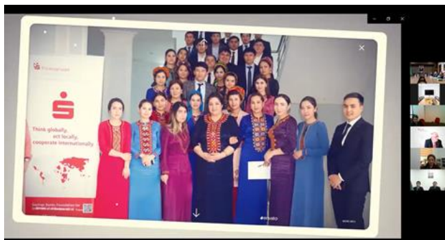
Präsentation des Projektfilms auf der Online-Abschlussveranstaltung in Turkmenistan

Die Abschlussveranstaltungen in allen Projektländern gaben Anlass zu Stolz und Zuversicht. Die Projektpartner würdigten die große Bedeutung der technischen Unterstützung und des Know-how-Transfers. In den Projektfilmen ließen Entscheidungsträgerinnen und Entscheidungsträger aller Ebenen, Trainerinnen und Trainer sowie Vertreterinnen und Vertreter der Zielgruppen die Aktivitäten und ihre Wirkung Revue passieren.