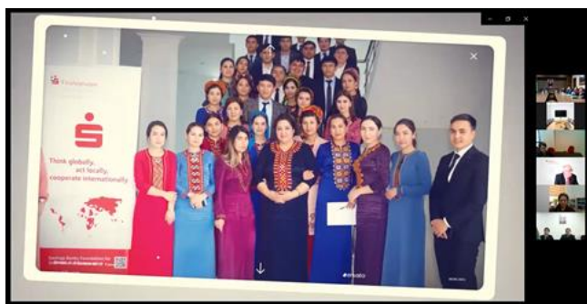
Презентация фильма о проекте на заключительном онлайн-мероприятии в Туркменистане

Заключительные мероприятия во всех странах проекта дали повод для гордости и чувства уверенности. Партнеры проекта отдали должное технической поддержке и предоставленному опыту. В проектном фильме руководители всех уровней, тренеры, а также представители целевых групп проанализировали все мероприятия проекта и их воздействие.