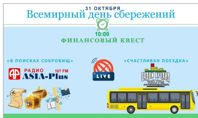
Всемирный день сбережений онлайн в Таджикистане

Национальные и Центральные банки продолжают дуальное обучение в различных регионах. Финансовая грамотность закреплена в учебных планах школ, интегрирована в структуры внешкольных кружков. Выгоду от участия в кампаниях по сбережению, не только в рамках Всемирного дня сбережений, банки распознали сразу же. Осенью 2020 года на основе результатов исследования «Тайный покупатель» при поддержке Шпаркassenштунга банки получили возможность повысить уровень качества обслуживания и консультирования по сберегательным продуктам.